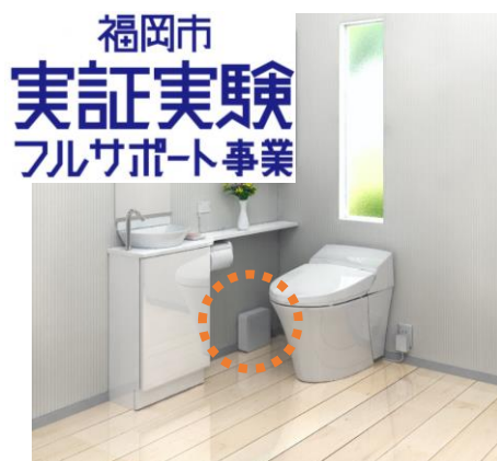
↑便器の左下に見えるのがデバイス